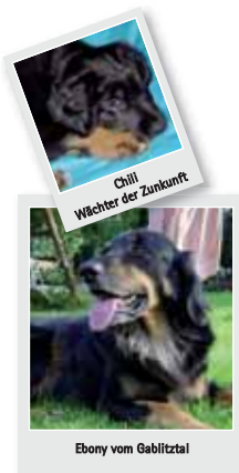
Ebony vom Gablitztal